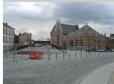
Infocenter im ehemaligen Bahnhofsgebäude