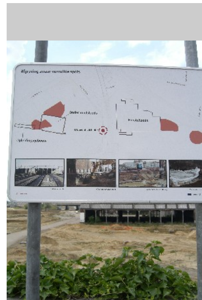
Informationstafel zur Geländekontamination

Die Methodik umfasst drei parallele Linien, die einander beeinflussen und ein System mit beweglichem Ziel bilden: 1. Schaffung der Vision 2. Maßnahmeniveau, Prüfung und Schaffung der Verbesserungen im Rahmenwerk 3. Sozialer Kontext der Kommunikation und Mitwirkung als ein entscheidendes Verbesserungsinstrument. Im Rahmen der allgemeinen Methodik werden GIS-Verfahren umfassend angewandt.