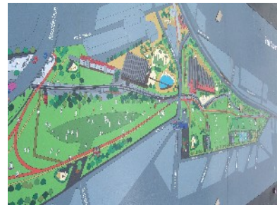
Entwurf Spoor Nord Infocenter im ehemaligen Bahnhofsgebäude

Die Hauptzielgebiete für die Stadterneuerung von Antwerpen wurden auf Grundlage der akademischen Studie über Armut und Chancen, die in den 90er Jahren auf regionaler Ebene durchgeführt wurde, ermittelt. Diese Zielgebiete erstrecken sich von der Eisenbahn, nördlich des Stadtzentrums, und Nachbarbezirken, bis zum Gebiet Spoor Noord und darüber hinaus. Da es keinen Generalbebauungsplan für das Stadtgebiet insgesamt