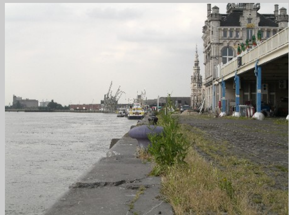
Alter Hafen von Antwerpen

LUDA is a research project of Key Action 4 "City of Tomorrow & Cultural Heritage" from the programme "Energy, Environment and Sustainable Development" within the Fifth Framework Programme of the European Union. http://www.luda-project.net