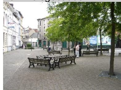
Quartierplatz im angrenzenden Wohnviertel