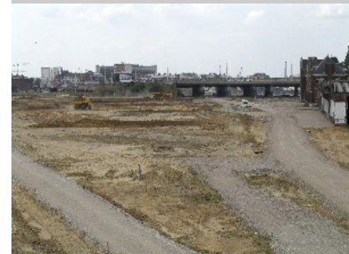
Blick auf zukünftige Spielrasen