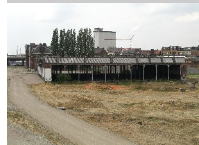
Blick auf zu renovierende Werkshallen