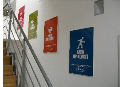
PR-Kampagne zur Ankündigung des geplanten Parks