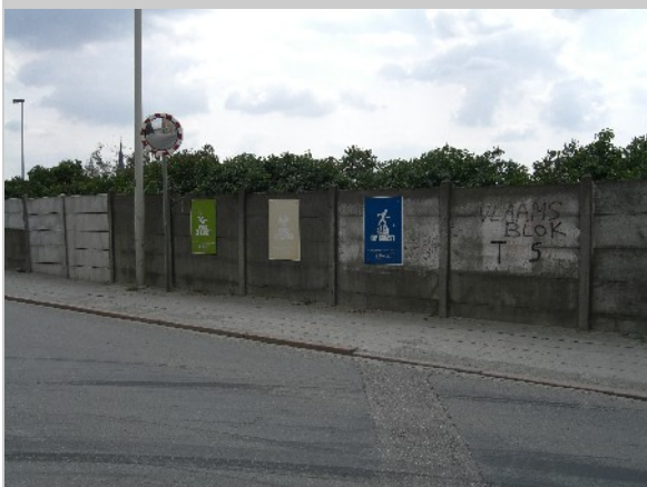
PR-Kampagne zur Ankündigung des Parks