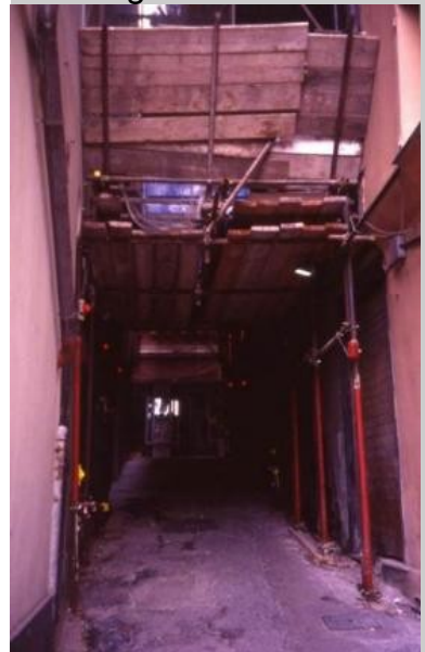
Sanierungsarbeiten in den Gassen