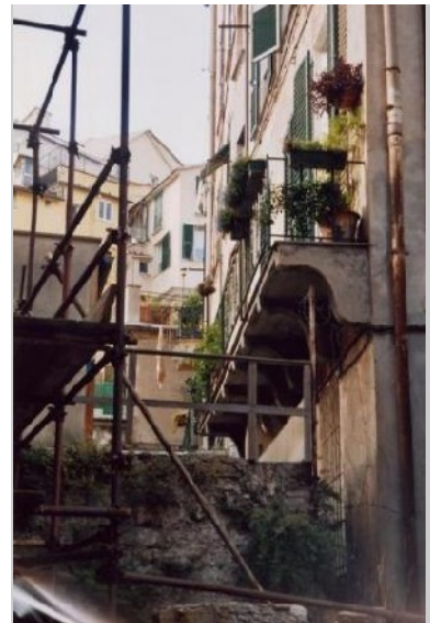
Absicherung der historischen Bausubstanz

In den vergangenen Jahren vollzog sich unterstützt durch große öffentliche Ereignisse (Weltcup 1990, Columbus-Feierlichkeiten 1992, das G8-Treffen 2001 und die Ernennung zur Europäischen Kulturhauptstadt 2004), der allgemeine Prozess der Sanierung von Genua nach einer größeren Entwicklungsstrategie der örtlichen Verwaltung. Die Wiederbelebung und Erneuerung des Centro Storico ist auch eines der Hauptziele der Stadt. Gemäß diesen