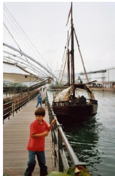
Neuer Yachthafen im alten Hafengebiet