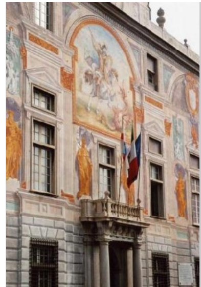
Sitz der Hafenverwaltung