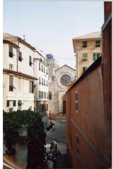
Architektur-Fakultät – Verbindung von Alt&Neu