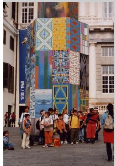
Kulturveranstaltung in der Altstadt