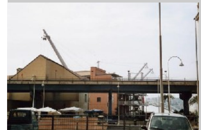
Hochstraße zwischen Hafengebiet und Altstadt