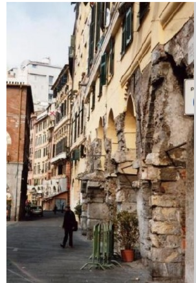
Bogengang am Hafen