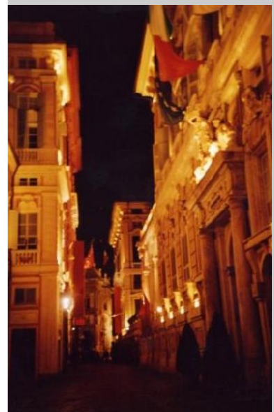
Beleuchtung der Via Garibaldi