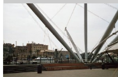
Kunstobjekte am Hafen