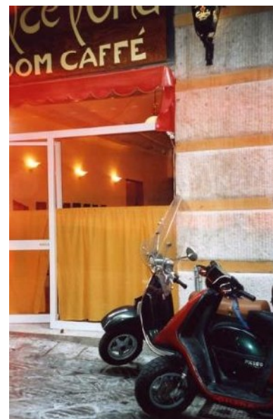
Kleine Geschäfte in der Altstadt

Nicht alle der erforderlichen Maßnahmen können direkt und sofort realisiert werden. Infolge der bestehenden Prioritäten müssen einige der kritischsten und gleichzeitig wertvollsten Fragmente der Altstadt in ihrem Zustand bleiben, einfach weil die Mittel noch nicht zugänglich sind oder administrative Hindernisse einen Eingriff unmöglich machen. Für solche Fälle wurde die kulturelle Kartierung der Altstadt und des Hafenviertels eingerichtet, um Beschränkungen, denen ein Denkmal unterliegt, zu aktualisieren, den statischen Zustand zu überwachen, topografische und architektonische Vermessungen durchzuführen, die Dokumentation aller historischen Denkmäler zu führen und wenigstens die Informationen zu retten, wenn schon nicht die tatsächliche Substanz. Die Anwendung von GIS-Techniken ist die Zukunftsperspektive der Dokumentation, durch die sie zu einer wichtigen Quelle der zukünftigen Planungsaktivitäten wird. Die Kartierung reicht von der Ebene des gesamten Gebiets bis hinunter zur Ebene der einzelnen Gebäude. Die überwachten Domänen sind: Ästhetik, Zugänglichkeit, physische Umgebung, sozial-ökonomische Bedingungen sowie Dokumentation und Forschung, was im Fall der historisch sehr wertvollen Objekte, die infolge der beschränkten Mittel vernachlässigt werden, besonders