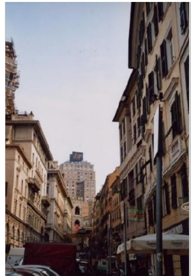
Altstadt und Rathausneubau