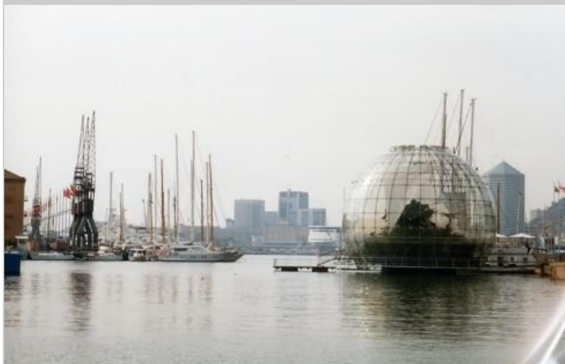
Neues Hafenzentrum mit Biosphäre