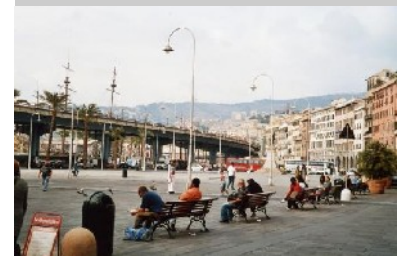
Neu gestaltete Freifläche