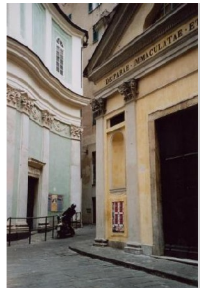
Sanierung kirchlicher Gebäude

Seitens der Stadt Genua waren die Comune di Genova und Osservatorio Civis für die Initiierung und Unterstützung der Maßnahmen im Rahmen des Einheitlichen Maßnahmeplanes verantwortlich, der sich als direkter Impuls für die privaten Aktivitäten und die interne Dynamik der örtlichen Gemeinschaften verstand, ergänzt durch die strenge Kontrolle der Ausführung der Pläne: gegenüber der zu unterstützenden und unabhängigen Gesellschaft, der die Chance zur Entwicklung und die Bedingungen, aktiv zu sein, gegeben werden. Für den langfristigen Prozess der Erneuerung wurden mehrere private Investoren zur Beteiligung aufgefordert und so die