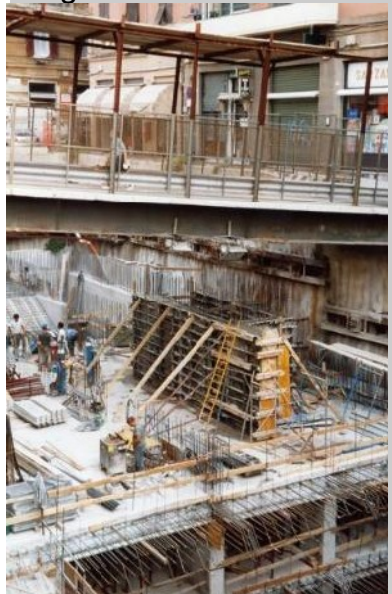
Bau einer neuen U-Bahnstation