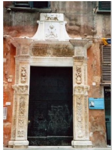
Details an historischen Gebäuden

Der Operative Plan enthält geplante und bereits begonnene innovative einheitliche Maßnahmen. Seine vier Hauptziele sind: physische Maßnahmen an Gebäuden und öffentlichen Anlagen, Verbesserung der Zugänglichkeit, sozial-ökonomische Verbesserung sowie Mitwirkungs- und operative Instrumente für die Bürger.