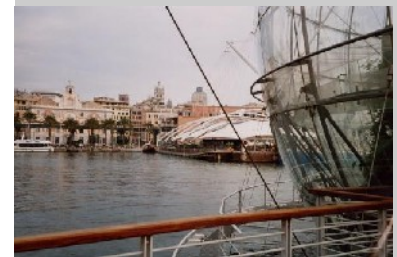
Blick vom Hafen in die Altstadt