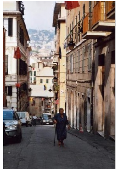
Dicht bebaute Altstadt

Der zeitgemäße strategische Plan setzt auf die neue Wahrnehmung Genuas als Hafen, Touristen- und Kulturstadt, ist auf Anlagen orientiert, nutzt den prächtigen alten Teil der Stadt, die Verbindung zum Meer und sieht die Restaurierung des nicht unerheblichen architektonischen Erbes vor.